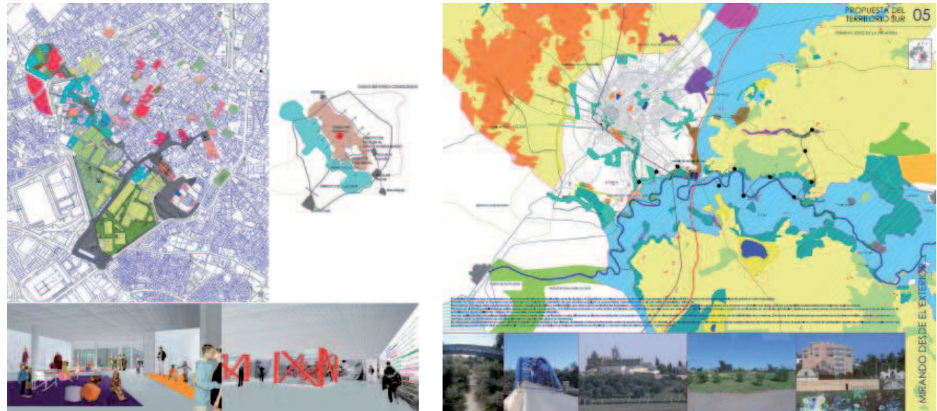
Propuestas para el centro histórico y Jerez-Sur-Guadalete. MARPH

des estuarios del Guadalete y del Guadalquivir. Hasta nosotros, un devenir de geografías con grandes transformaciones, y con estas, distintas travesías estratégicas que vendrían a explicar la fundación de Jerez como núcleo urbano, tan sólo hace un milenio. Las movildades sobre este territorio inestable estarán determinadas por las cambiantes situaciones de centro-periferia que las economías-mundo acontecidas a lo largo del tiempo roturaron en este extremo occidental de la Península.