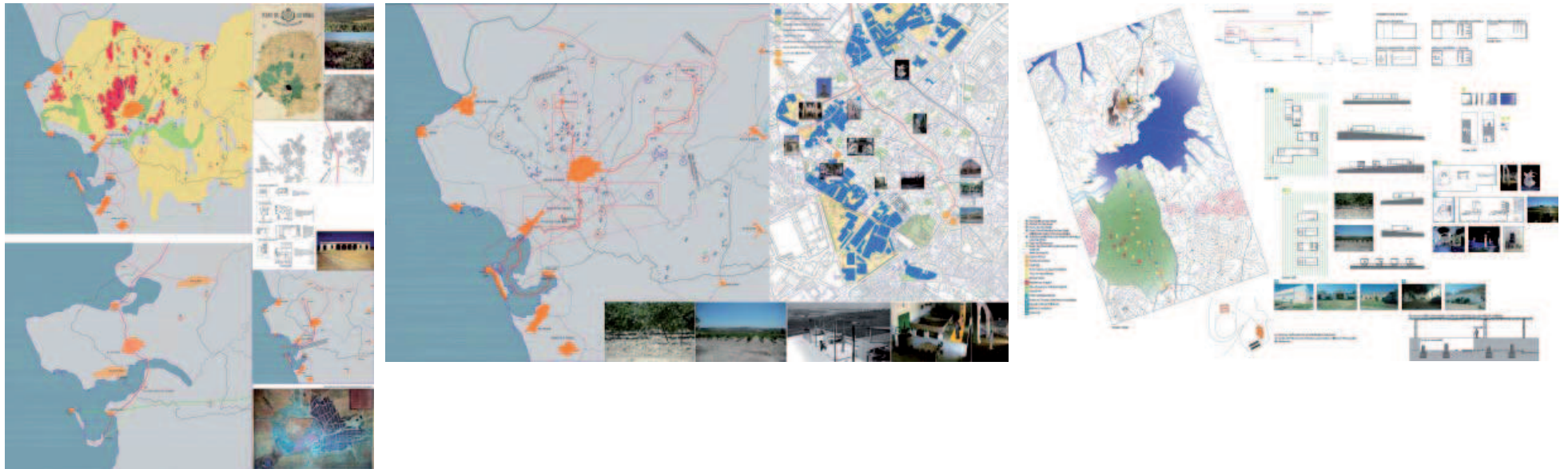
Usos del suelo, morfo-tipologías de la Campiña y trazado de la Vía Augusta. Áreas de intervención en el territorio y la ciudad. Intervenciones para Jerez-Mesas de Astas. MARPH

-Jerez-Norte: Campiña Guadalquivir (Mesas de Asta). Santiago. San Miguel. Calle Francos.