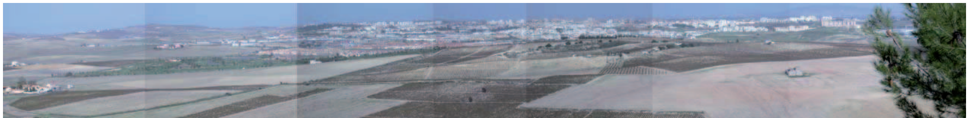
Panorámica de Jerez desde el Cerro de San Cristóbal. JVA