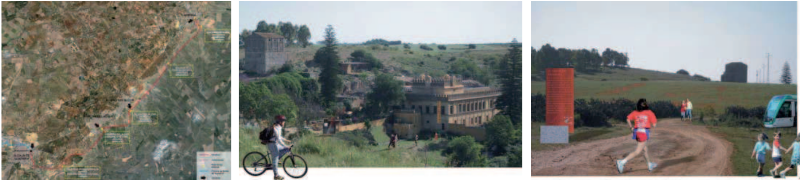
Trazado del "Alcotren". Sede del "Parque Cultural de Los Alcores". Tránsitos/ SLH-LLA

física del territorio y de sus circunstancias socio-económicas.